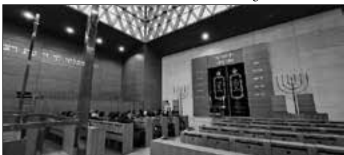
Hauptraum der Synagoge

„Im Gang der Erinnerungen stehen alle Namen der Juden, die in München während des Nationalsozialismus getötet wurden.“