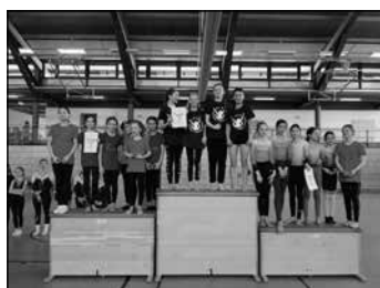
Foto: Unsere Turnerinnen aus der 6. Klasse

Beim Wettbewerb der 5./ 6.-Klässler stellte sich eine Mädchenmannschaft den Herausforderungen und verwies die Teams aus der Realschule auf die Plätze 2 und 3. Bei allen Kindern war die Freude riesig und sie erhielten ein Landkreis-Sieger-T-Shirt.