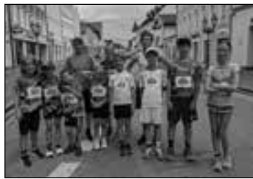
Laufteam Schliersee beim Straßenlauf in Wolfratshausen