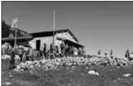
Die motivierte Jugend