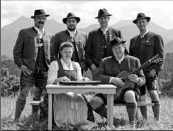
„Haushamer Bergwachtgang“