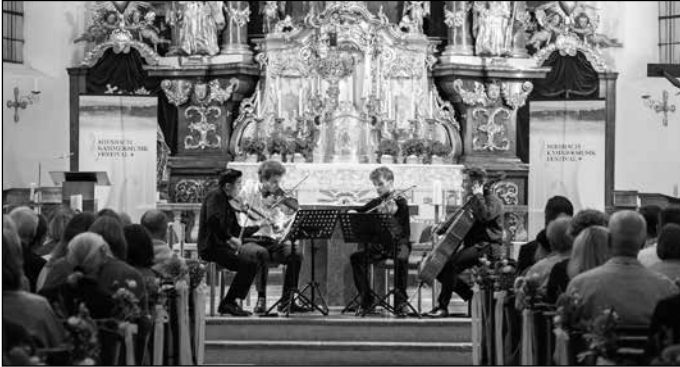
Junge Musiker mit Motivation: vier der Künstler im vergangenen Jahr beim Konzert in der Schlierseer Kirche St. Sixtus. Heuer findet es im Bauerntheater statt.

Für die Musiker selbst ist es ein kreatives Gemeinschaftserlebnis, fürs Publikum ein musikalischer Hochgenuss. Im Rahmen des Miesbach Kammermusikfestivals kommen im August zum dritten Mal preisgekrönte Nachwuchskünstler verschiedener Nationen in den Landkreis, um ein herausragendes Musikprogramm zu präsentieren. Am Mittwoch, 23. August , gastieren sie mit Unterstützung des Rotary Clubs Schliersee auch in der Marktgemeinde – um 19 Uhr im Bauerntheater.