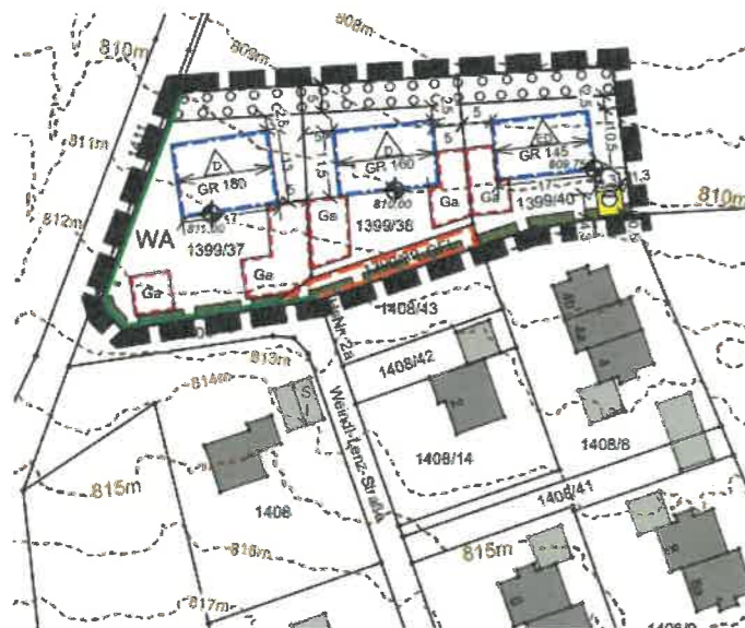
Bebauungsplan Nr. 47 „Stolzenbergstraße-Ost“

Der Marktgemeinderat Schliersee hat in seiner öffentlichen Sitzung vom 23.09.2025 die vom Planungsverband Äußerer Wirtschaftsraum München ausgearbeiteten Entwürfe der 3. Änderung des Bebauungsplans Nr. 47 „Stolzenbergstraße-Ost“ und der 43. Änderung des Flächennutzungsplans in der Fassung vom 23.09.2025 gebilligt und die Auslegung nach § 3 Abs. 2 BauGB bestimmt. Der künftige räumliche Geltungsbereich des Bebauungsplans bzw. Flächennutzungsplans ist aus den nachfolgenden Lageplänen ersichtliche, welche Bestandteil dieser Bekanntmachung sind.